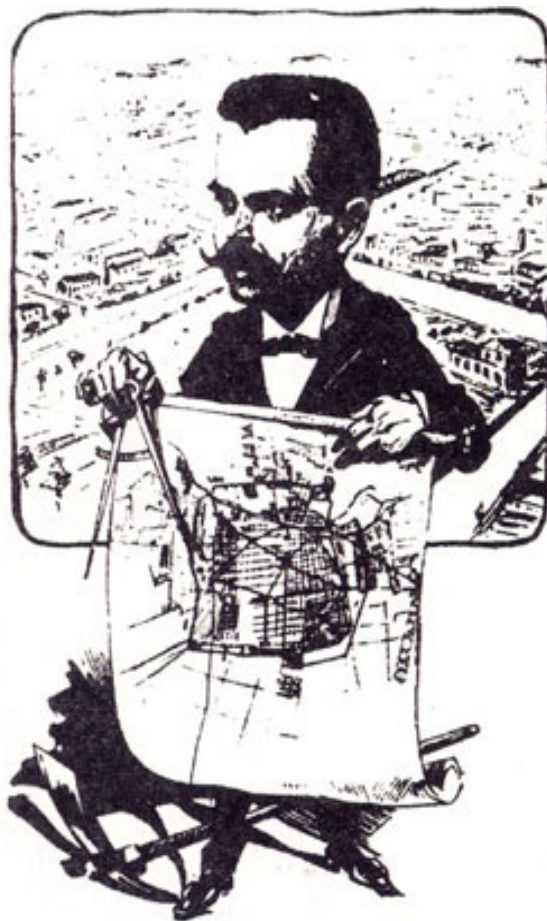
Fig. 5: Carlos Carvajal Miranda. Caricatura publicada por la prensa local de la época, igualándolo irónicamente con imágenes de Eugène Haussmann, el gran urbanizador del París de fines del siglo XIX. En Diario Ilustrado de Santiago, c. 1912