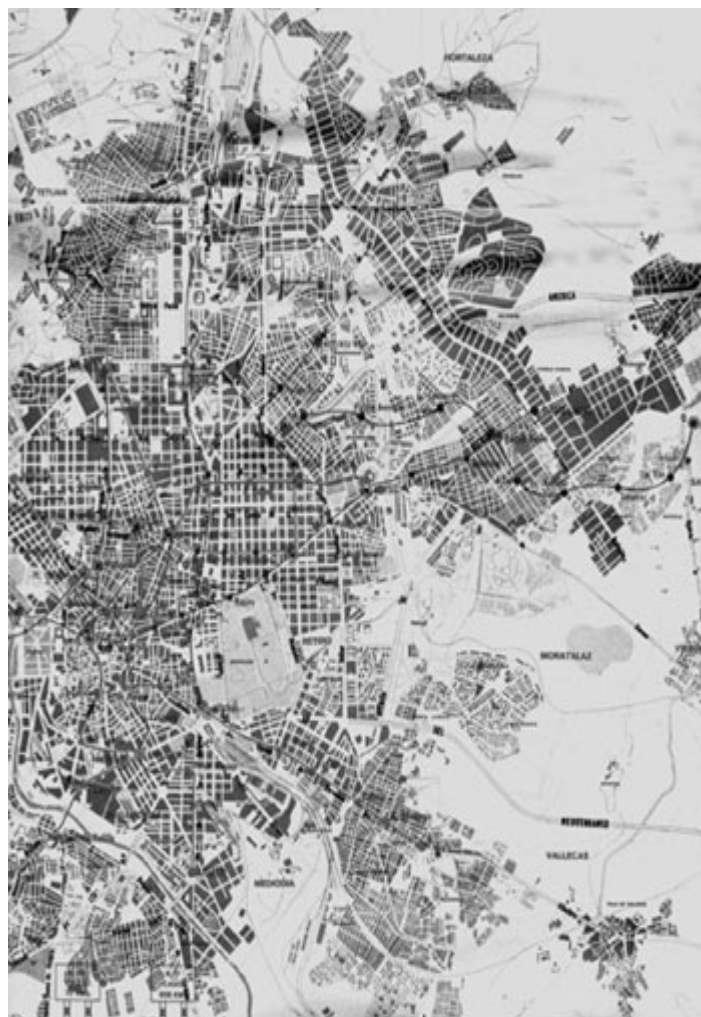
Fig. 3: Ciudad Lineal en el plano callejero de Madrid, 1979.