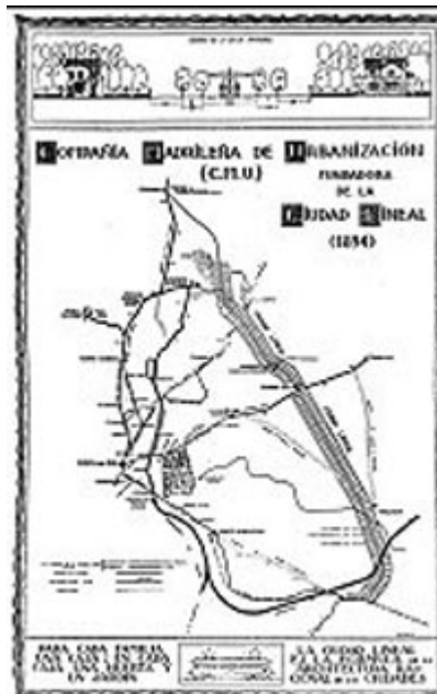
Fig. 1: Cartel de propaganda de la Ciudad Lineal de Madrid, publicado por la Compañía Madrileña de Urbanización. En George COLLINS et al. Arturo Soria y la Ciudad Lineal . Ediciones Revista de Occidente, Madrid, 1968.

El contacto pleno y directo con la naturaleza que posibilita la casa unifamiliar aislada, con abundante terreno para huertas y jardines, se presenta como una solución al oscuro cuadro que exhiben por aquellos años las áreas centrales de las ciudades europeas de fines del siglo XIX e inicios del XX: deplorables condiciones higiénicas; promiscuidad; altas densidades y crecimiento disperso; infravivienda y degradación física y socioeconómica; dificultades para la normal circulación de los nuevos transportes motorizados. Cuestiones no distintas a las que, con mayor o menor gravedad, se registran hoy en gran parte de las ciudades del planeta.