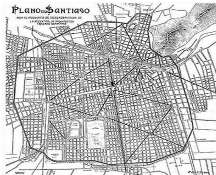
Fig. 4: Ciudad Lineal de Centenario. En proyecto de transformación presentado por la Sociedad de Arquitectos de Chile. En Diario El Mercurio, 28 de julio 1912.

En la década del cuarenta del siglo XX, mientras los herederos de Arturo Soria –sus nietos Arturo y Carmelo- empujados por la Guerra Civil española emigran a Chile, dedicándose a la divulgación de la obra literaria de poetas españoles de la llamada Generación del 27 y de jóvenes escritores del país [11] , la construcción de la ciudad lineal madrileña queda definitivamente detenida, en un momento en que el crecimiento físico insinuaba su anexión a la gran ciudad. Por aquellos mismos años, la huella propositiva de Carvajal Miranda, dibujada a lo largo de más de tres décadas, comienza a diluirse hasta quedar reducida a una serie de artículos y planos dispersos en revistas técnicas y periódicos locales. Aunque las problemáticas que la motivaron permanecen sin corrección y su contenido ha quedado atrapado en el maximalismo de las utopías, cuestión propia del urbanismo precientífico , su lectura nos aproxima a la memoria territorial de Chile y urbana de la ciudad de Santiago de Chile.