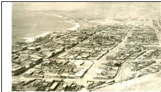
Fig. 2. Vista de Tocopilla, hacia el nor-oriente, c. 1943. Destacan las calles 21 de Mayo y Sucre. Al fondo, el cementerio, y como remate de la calle Sucre, nuevas poblaciones obreras. Foto postal en Archivo Karl Brunner, Departamento de Urbanismo de la Facultad de Arquitectura y Urbanismo de la Universidad de Chile. Post Card EKC s/f.

En general, observó Brunner que en todas las ciudades del norte se había trabajado mucho, y de acuerdo a planos inteligentes y metódicos, destacando especialmente las obras portuarias. Sin embargo, estimaba necesario armonizar las obras portuarias con las obras ferroviarias y con la edificación urbana. En suma, en adelante había que planificar el futuro de dichas ciudades considerando todas sus funciones.