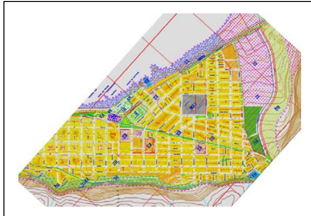
Fig.1-B. Segmento de plano de Tocopilla actual, en zona de la propuesta por Karl Brunner.

En general, observó Brunner que en todas las ciudades del norte se había trabajado mucho, y de acuerdo a planos inteligentes y metódicos, destacando especialmente las obras portuarias. Sin embargo, estimaba necesario armonizar las obras portuarias con las obras ferroviarias y con la edificación urbana. En suma, en adelante había que planificar el futuro de dichas ciudades considerando todas sus funciones.