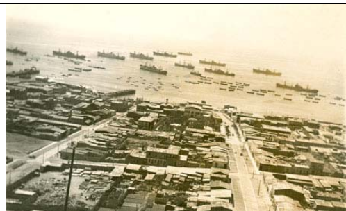
Fig. 3. Vista de Tocopilla hacia el océano Pacífico, c. 1943. Se observa la plaza, aproximadamente en el eje de la zona de "Baños Municipales".