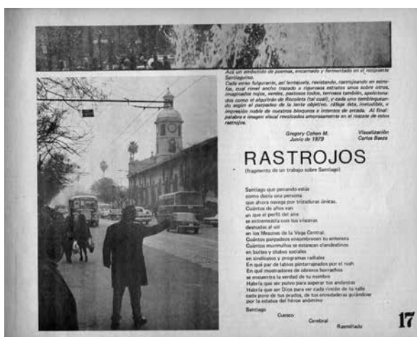
Fotografía de Carlos Baeza.

La imagen que ilustra la carátula de la casete y del LP que contiene la canción, en cambio, resulta mucho más esperanzadora y, en cierto modo, juvenil que las proporcionadas por La Bicicleta . Se trata de una ilustración en colores que recuerda las pinturas oníricas de Marc Chagall –como Los novios de la Torre Eiffel (1938)–, con personas y objetos volando sobre un Santiago brumoso pero con un arco iris esperanzador 23 (ver láminas 3 y 4).