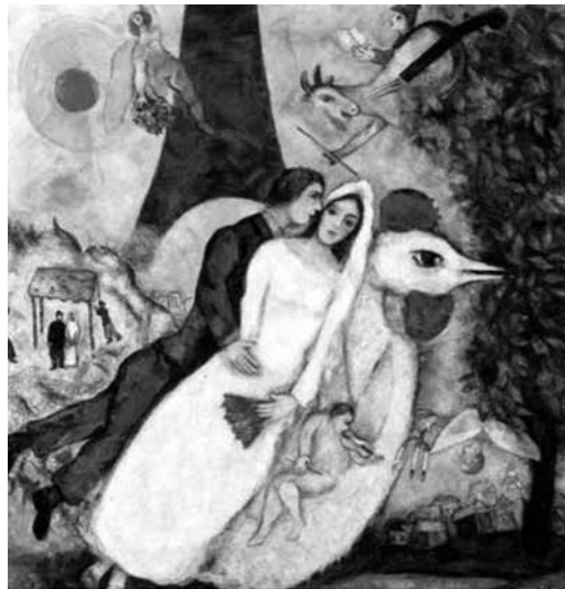
Marc Chagall, Los novios de la Torre Eiffel (1938).

En un primer plano absoluto se destaca un gran semáforo –otro ícono urbano relacionado con el ícono sonoro de motores y bocinas–, con una enorme luz roja que sirve de advertencia, consigna y sustento para el nombre del grupo y del disco, que invita a detenernos y observar lo cotidiano, como diría Godoy. Al fondo, el