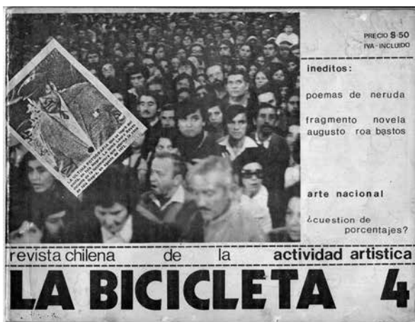
Portada de La Bicicleta N° 4, 8/1979.