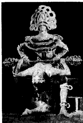
Escena de "Calaucán", los dioses derriban a los indios