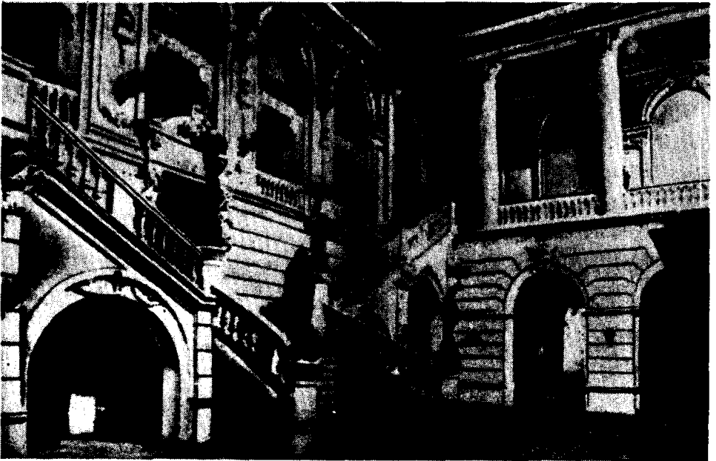
2.—Antiguas escalinatas del Teatro Municipal de Santiago.