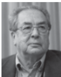
MIGUEL LETELIER VALDÉS (1939)

Homenaje posee una forma tripartita. Se inicia con un tempo “Tenso” (negra=ca.78) conformado, primero, por notas repetidas (un quintillo y una nota larga) en las trompetas, conjunto que decrece en intensidad desde un mezzo piano hasta un pianissimo. Le sigue otro conjunto que se caracteriza por estar constituido por trémolos en los violines primeros y segundos y sonidos largos en las maderas, en pianissimo, continuando luego partes de fuerte intensidad sonora que se alternan con partes de escaso volumen, pero siempre se recuerda el motivo enunciado por las trompetas al inicio de la pieza. Para terminar la sección, aparecen una vez más el quintillo y la nota larga, esta última como un tutti orquestal en que queda sonando un redoble de la caja, que poco a poco va desapareciendo. Después de un breve silencio se presenta la segunda sección, que tiene un tempo “Muy lento, expresivo” (negra=ca.48). Aquí se realiza un juego contrapuntístico, sustentado en series dodecafónicas, aprovechando la diversidad tímbrica de la orquesta. Homenaje concluye al reexponerse, con modificaciones, la primera sección”.