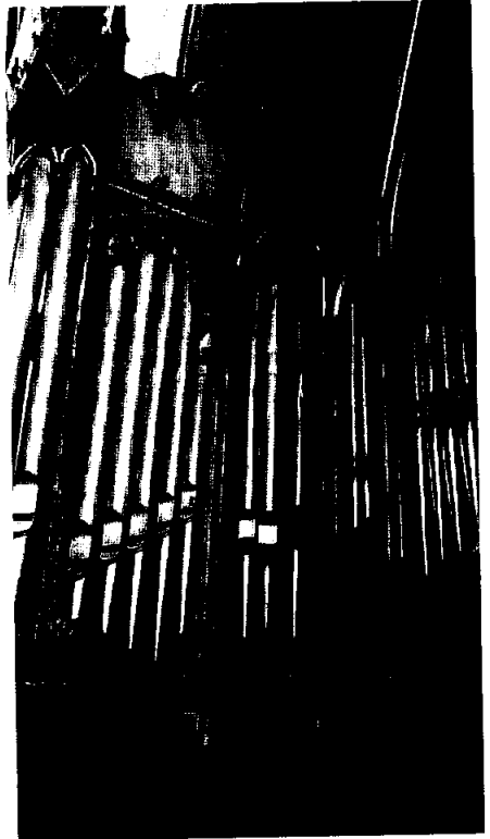
Órgano de la Iglesia de los Padres Franceses. Detalle de la parte izquierda del mueble

La disposición del pequeño instrumento es la siguiente: