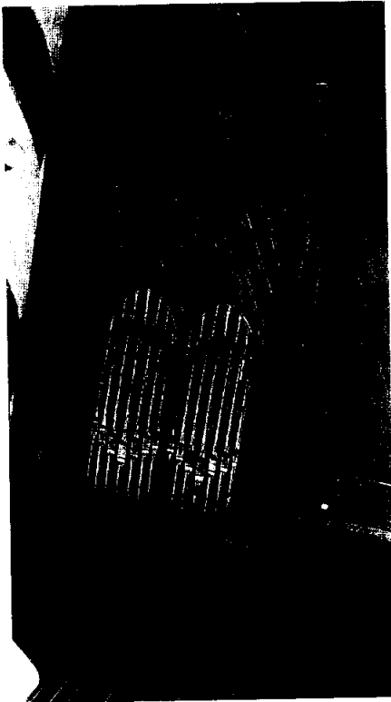
Iglesia de San Pedro, Santiago. Congregación del Buen Pastor. Teclado manual, 4 registros 1894