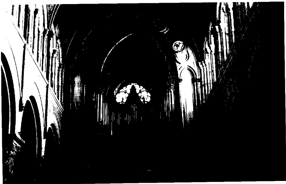
Iglesia de los Padres Franceses, Valparaíso. Vista general de la tribuna y del órgano