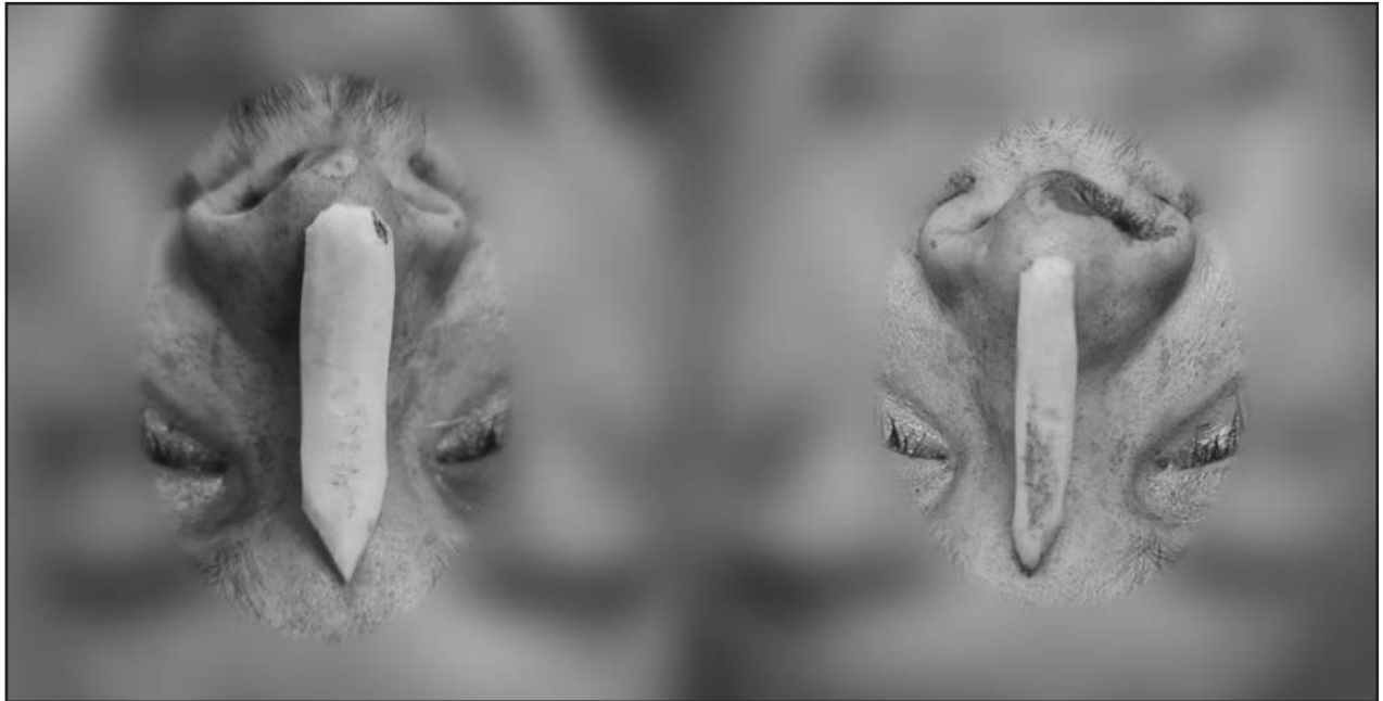
Figura 3. Posicionamiento de cartílago. Acceda a la imagen en color en https://bit.ly/30bNbki

de Killian, se talla injerto costal para insertarse en bolsillo dorsal y se cierra defecto en un plano (Figura 3). Posteriormente, se realiza bolsillo de punta nasal por acceso marginal izquierdo, se instala injerto de punta fijado, mediante aguja transfixiante y se cierra defecto en un plano (Figura 4). Se finaliza la cirugía y dado que el paciente evoluciona favorablemente en el postoperatorio, es dado de alta el mismo día de la intervención para seguimiento ambulatorio a los 14 y 30 días en policlínico (Figura 5 y 6). En el seguimiento, evoluciona con un trapdoor a nivel del dorso que se mantiene en observación.