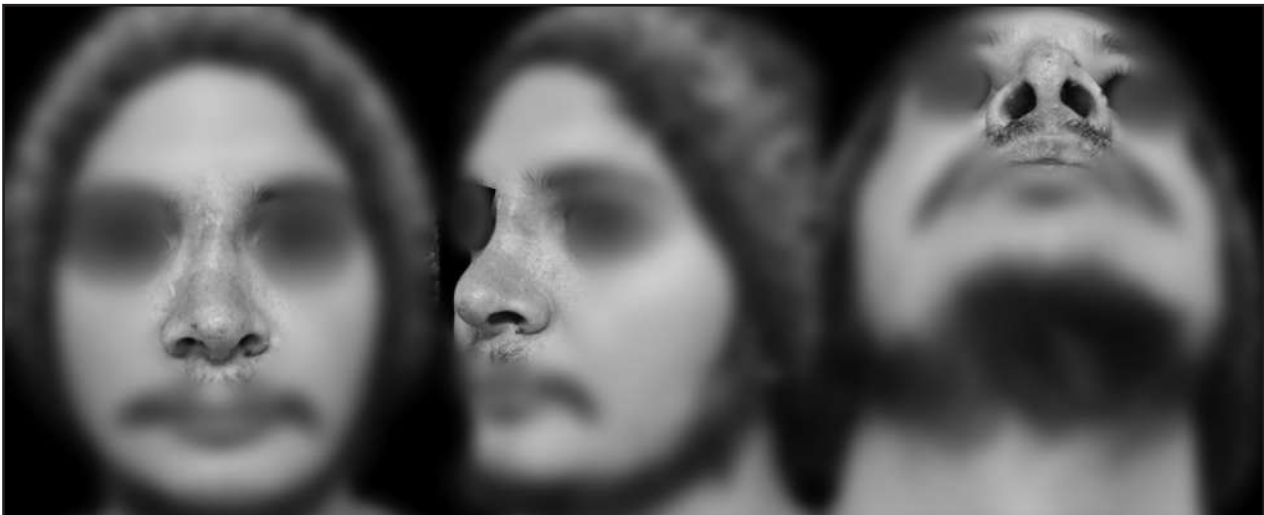
Figura 5. Días postoperatorios. Acceda a la imagen en color en https://bit.ly/30bNbkI

Para la extracción del cartílago costal, algunos cirujanos solicitan una radiografía para el descarte de calcificaciones óseas en el cartílago, las cuales se pueden presentar en pacientes de mayor edad (10) . Se pueden utilizar ambas parrillas costales; sin embargo, se utilizan habitualmente los cartílagos costales derechos para prevenir la confusión con el dolor torácico cardíaco. La elección de cuál costilla se utilizará dependerá de la cantidad de cartílago necesario para la reconstrucción nasal. Se pueden utilizar el 5°, 6°, 7° cartílago costal (11,12) (Figura 7).