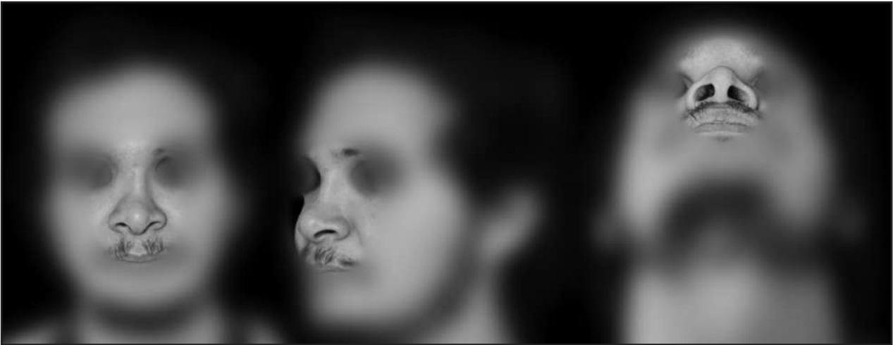
Figura 1. Preoperatorio. Acceda a la imagen en color en https://bit.ly/30bNbkI

Ingresa a pabellón para reducción y fijación intermaxilar, además de instalación de múltiples placas de osteosíntesis. La reconstrucción nasal se lleva a cabo con doble injerto de cartílago nasal, injerto óseo para el dorso e injerto de cartílago septal para construir vástago de la columela. Evoluciona de manera favorable durante estadía hospitalaria, por lo que se decide alta médica.