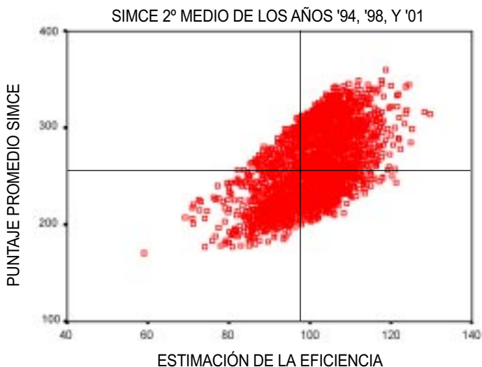
Figura 1: Eficacia y eficiencia de los centros de enseñanza media de Chile

La relación entre la eficacia y la eficiencia escolar para el conjunto de los centros escolares de enseñanza media de Chile puede observarse en la Figura 1.