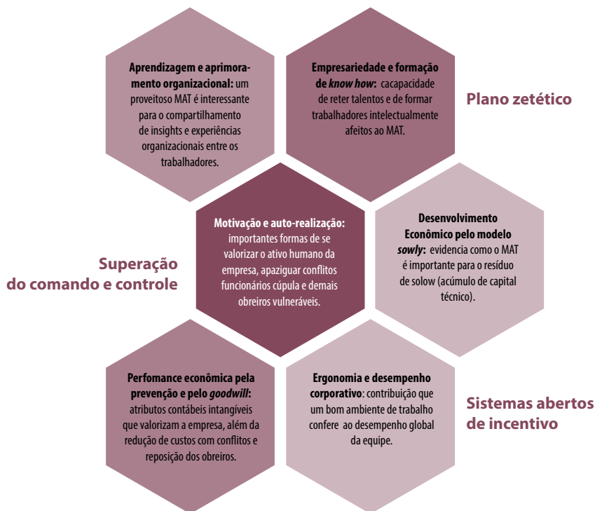
Figura 2. Dimensão dogmática do meio ambiente de trabalho.