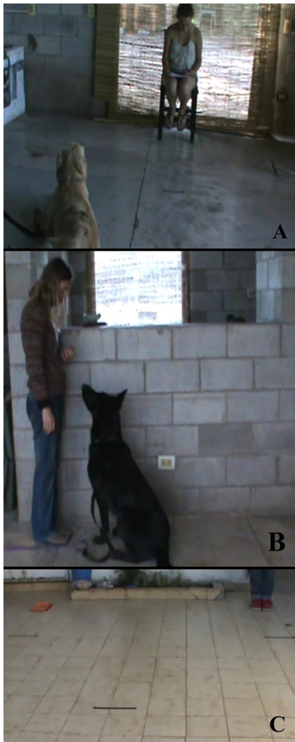
Figura 1. Imagen del set experimental utilizado en (A) la prueba de sociabilidad, (B) la tarea comunicativa de mirada y (C) la tarea de aprendizaje inhibitorio, a la derecha se coloca la persona, a la izquierda un plato con comida y en el centro, formando un triángulo se ubica al perro.