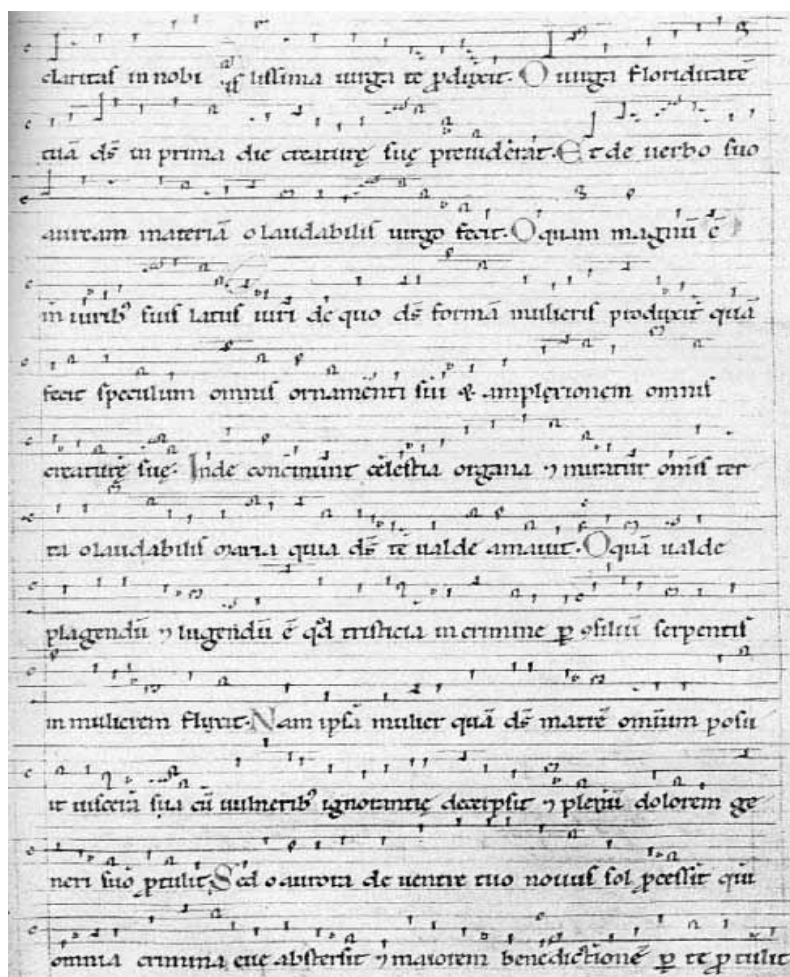
Calenda Maia Música y Teatro Medieval

Symphonia Harmoniae Caelestium Revelationum Hildegardis Bingensis (1098 - 1179) Ars Musicae et Ars Verbum