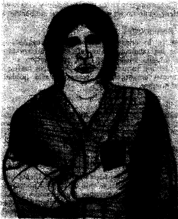
Lámina 2* EL PILLAN

Confiamos que estos breves ejemplos den cuenta de las diferencias y evaluación crítica que esperamos realizar en nuestro estudio. Creemos que el material por recoger permitirá enriquecer el conocimiento que actualmente se tiene de la cultura mapuche.