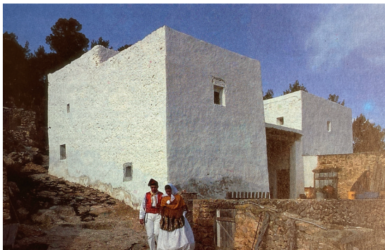
FIGURA 6 Can Frare Verd

Nota. Ferdinand et al., 1984, p. 119.