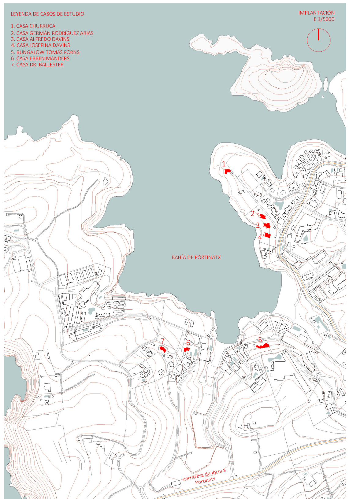
FIGURA 1 Plano de situación de las viviendas unifamiliares de Germán Rodríguez Arias en la bahía de Portinatx