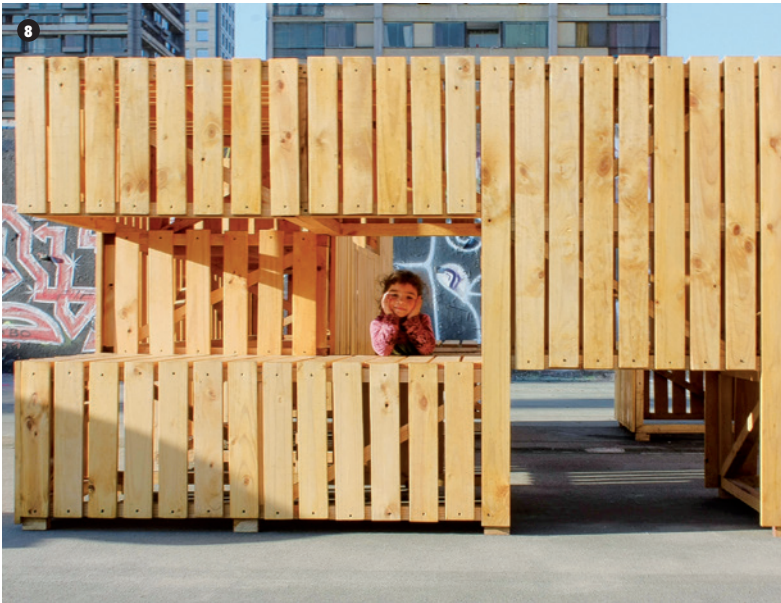
8, 9, 10 y 11. Obra Castillo San Borja.