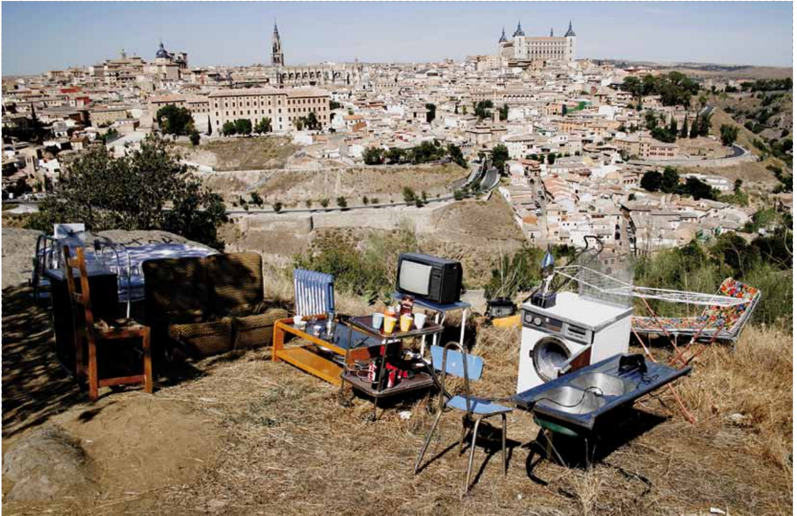
Obra: Toledo crea Toledo. Emplazamiento: Sala ECAT. Toledo, España. Año acción: 20/30 septiembre 2007. Coordinador: PKMN. Sitio web: www.toledocreatoledo.blogspot.com