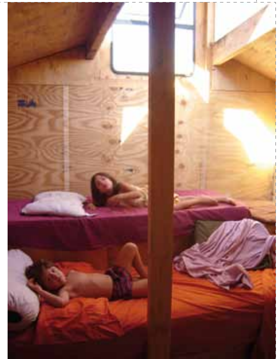
Obra: Cabina para niños. Plug out unit #1 . Ubicación: Boulogne Sur Mer. Provincia de Buenos Aires. Argentina. Año proyecto y construcción: 2006. Arquitecto: a77. Gustavo Diéguez / Lucas Gilardi.