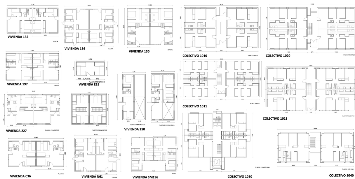
Figura 3. Dimensiones y plantas de vivienda en extensión y colectivos de viviendas diseñadas en CORVI entre 1966 y 1971.