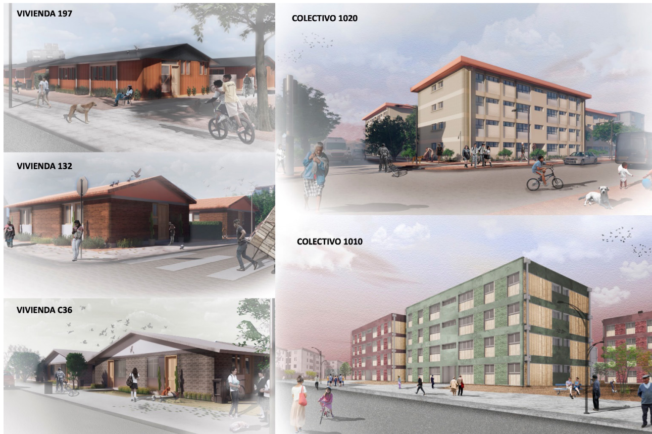
Figura 4. Fotomontajes de viviendas en extensión y colectivos de viviendas diseñadas en CORVI entre 1966 y 1971.