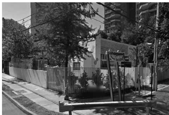
FIGURA 5: SALA CUNA Y JARDÍN INFANTIL UBICADO EN CALLE FLOR DE AZUCENAS NRO.145.