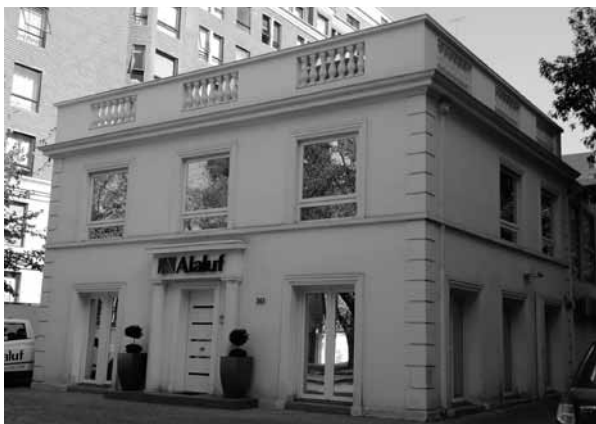
FIGURA 2: EDIFICIO DE OFICINA DE SERVICIOS PROFESIONALES UBICADO EN CALLE HENDAYA NRO.263.