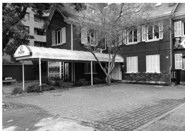
FIGURA 3: EDIFICIO DE EDUCACIÓN SUPERIOR, ESCUELA DE COCINA EN AVDA. AMÉRICO VESPUCIO SUR NRO.930.