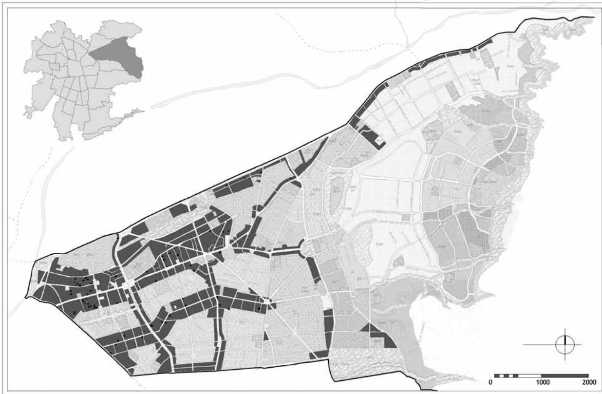
FIGURA 1: PLANO DE LA COMUNA DE LAS CONDES SEÑALANDO LAS ZONAS DE APLICACIÓN DE LA NORMATIVA DE PREDIO EXISTENTE RESIDUAL DE DENSIFICACIÓN E IDENTIFICACIÓN DE LOS PREDIOS