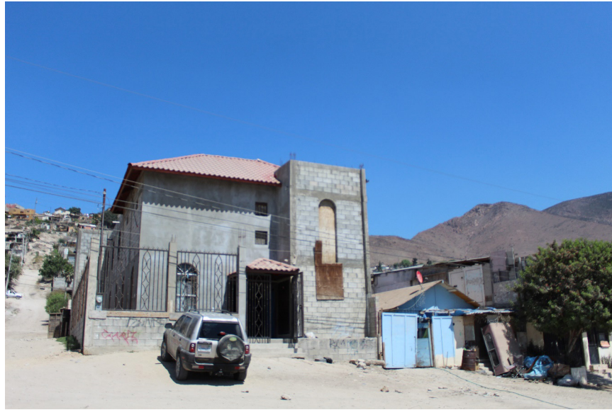
Figura 1. Colonia Terrazas del Valle, Tijuana, 2019.