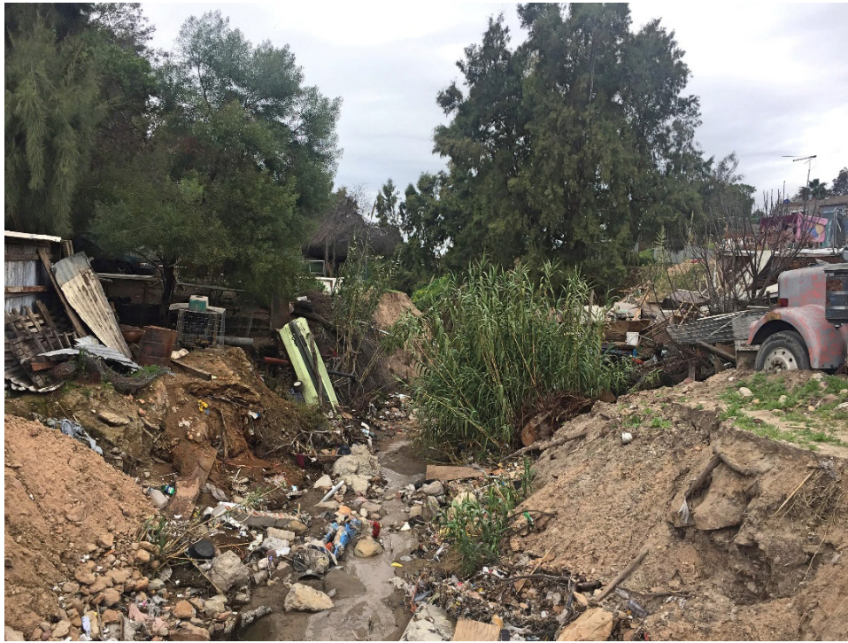
Figura 4. Colonia Valle Verde, Tijuana, 2019.

Así, como se ha referido la organización que se concretó en construcciones y la formalidad de una escolaridad institucionalizada con el eje étnico, en este caso a nivel pre-primaria y primaria, también la colonia se vio beneficiada en cuanto a la infraestructura urbana, por ejemplo, esto es notorio en el pavimentado de las calles y el establecimiento de los servicios públicos básicos. Esto nos lleva a comprender estas consideraciones donde son los sujetos, en sus capacidades de actuar, quienes resuelven sus demandas inmediatas, entre las que se incluye las de bienestar, en su sentido de habitar en un espacio, en este caso urbano, donde se tengan los accesos mínimos, de vialidad por ejemplo, y en caso de no involucrarse con estas demandas, corren el riesgo de no “ser alcanzadas” por los beneficios generales de la urbanización, a pesar de que hemos visto que el crecimiento de Tijuana, se encaminaba a estas zonas, el planeamiento urbano no se dispone en estos sectores.