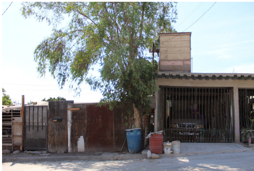
Figura 2. Colonia El Pipila, Tijuana, 2019.

De tal forma que este marco de referencias me permite explicar las segregaciones en el espacio, Tijuana se inserta en una serie de estructuras históricas-urbanas, pero se conforma desde particularidades, como su característica de fronteridad y su sinuoso terreno, y si bien pueden tejerse diálogos con otras ciudades de Latinoamérica, habrá que