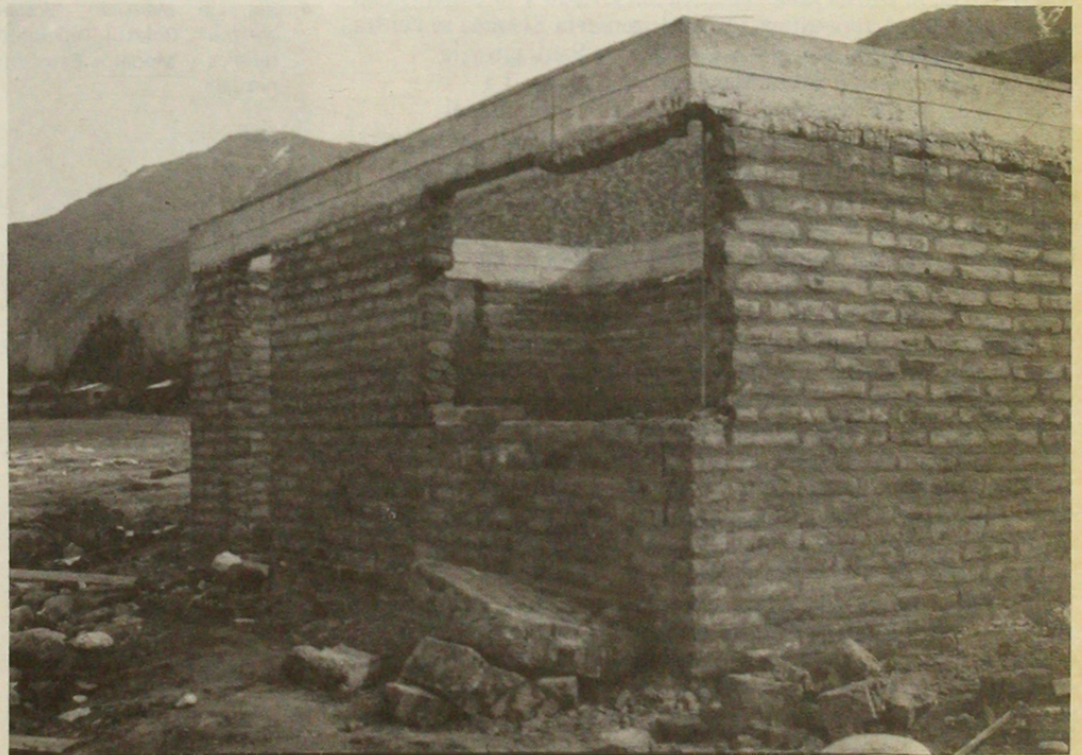
Valle del Choapa, 1971. Vaciamiento de albañilería.

Un capítulo importante de la norma se refiere a exigencias de estructuración, de las cuales se mencionarán solo las que se