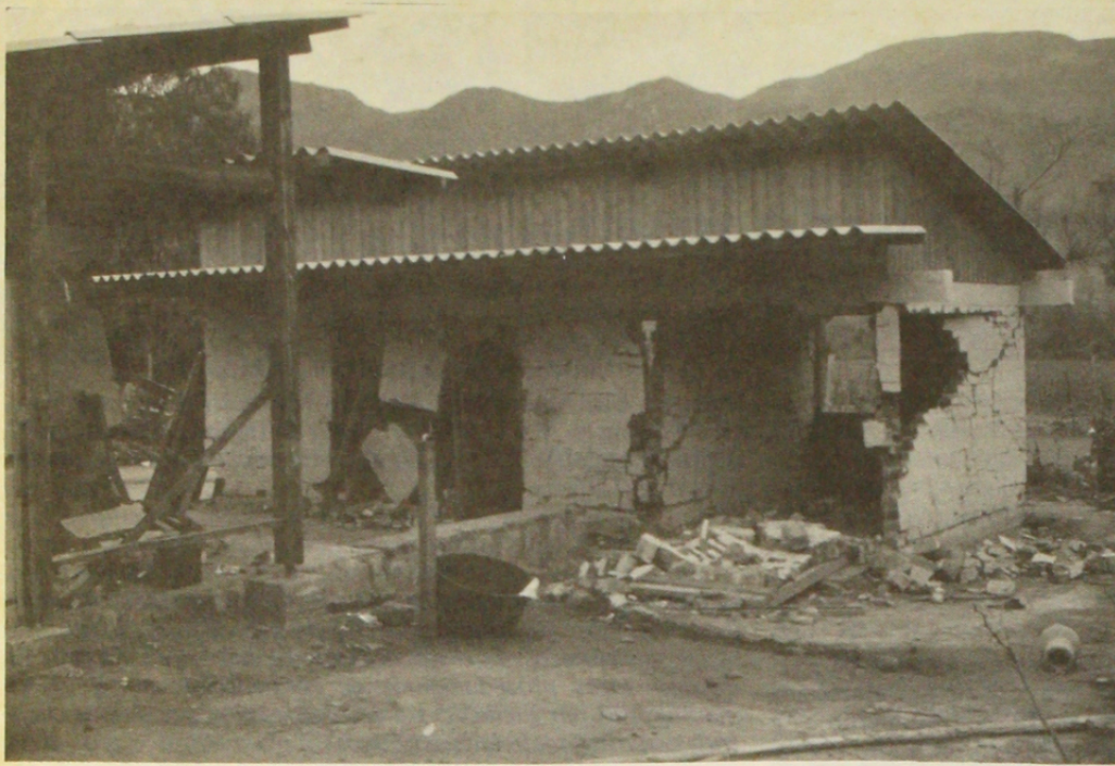
Valle del Choapa, 1971. Albañilería de ladrillo fiscal con cadena superior y tensores en las esquinas.

uno de los terremotos más grandes de la historia sísmica mundial, alcanzando intensidades máximas de hasta 11 (MM) en la zona de Valdivia.