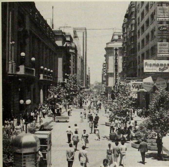
Vista del Paseo Ahumada frente al Banco de Chile. Arriba su realidad hoy, abajo perspectiva del proyecto.