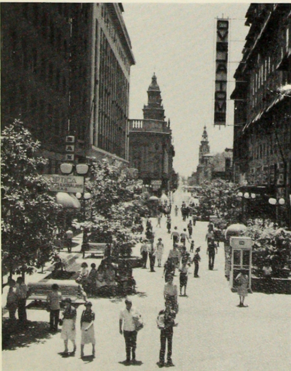
Visión desde el Paseo Ahumada hacia la Plaza de Armas y torres de la Catedral Metropolitana. Actualmente ha irrumpido en esta perspectiva una torre de cristal-espejo. Ver fotografía página 22.