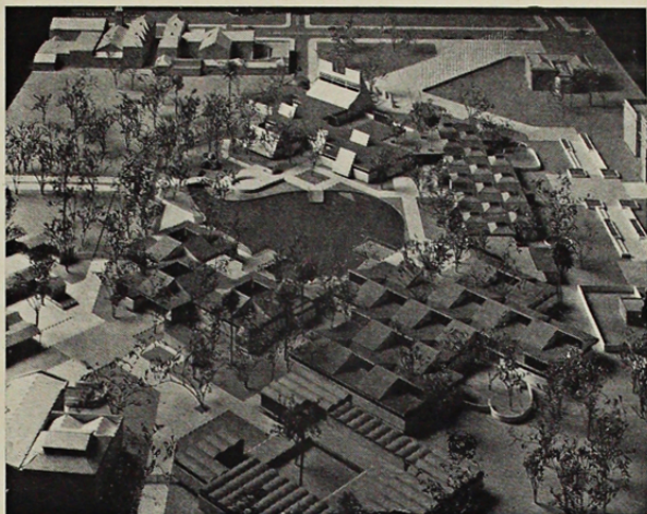
MAQUETTE DE LOS PABELLONES QUE ACOGERAN LA EXPOSICION

El Concurso Internacional de Arquitectura denominado AREA DE REMODELACION EN EL CENTRO DE SANTIAGO DE CHILE es una competencia nacional e internacional de ideas de diseño habitacional y proposiciones de remodelación urbana que se plantea como evento complementario a la Exposición Internacional y motivado por ella. El manejo de este Concurso, patrocinado