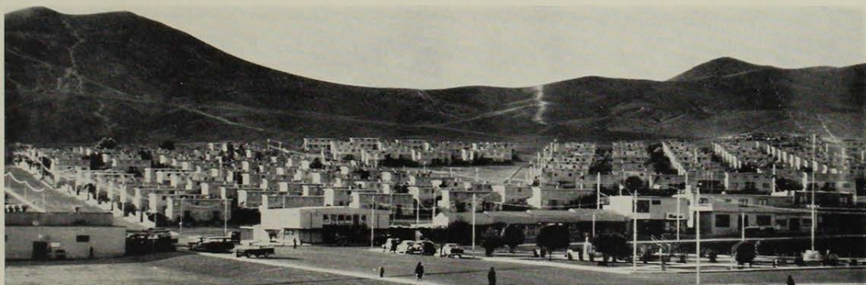
Centro Comercial visto desde el Mercado a través de la Plaza Central. Se aprecia con claridad el emplazamiento de la ciudad en la falda del cerro y la disposición radial de sus calles, todas convergiendo a la Plaza.

Una de las calles del Sector Residencial de obreros y empleados, y que se caracterizan por su conformación semicircular y concéntrica. Las viviendas están resueltas en dos niveles, ingresándose a los segundos pisos por la calle posterior.