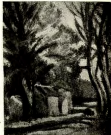
DUNOYER DE SECONZAC.—Paisaje

La Galería Braun ha abierto una exposición de muy buena pintura