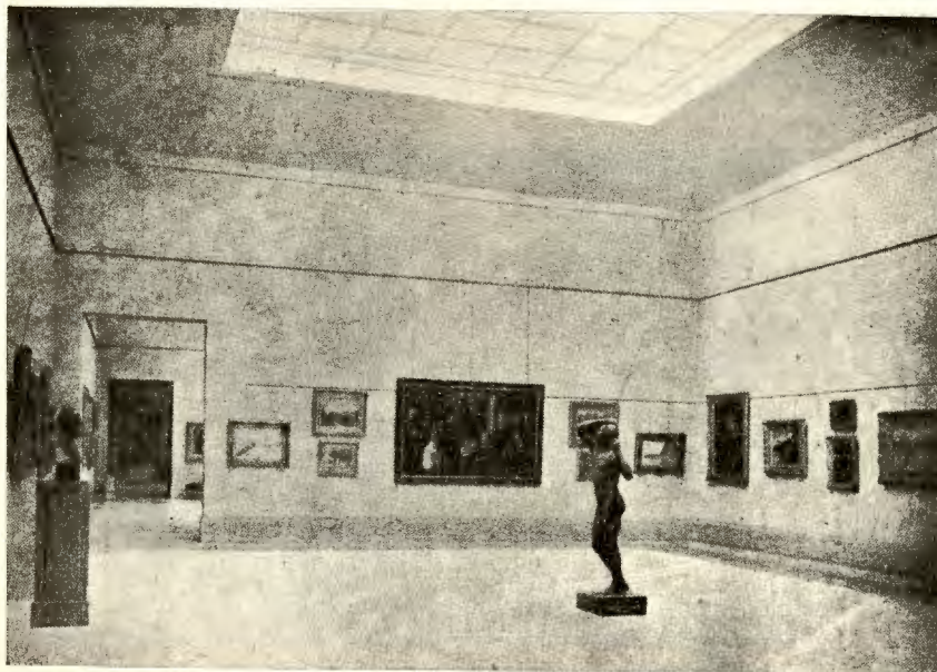
Una sala de pinturas del siglo XIX

Durante la última temporada las noticias musicales de Francia nos traen el eco de interesantes primeras ejecuciones tanto en el dominio teatral como en el de la música sinfónica y de cámara.