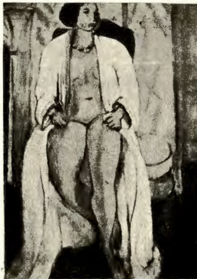
H. MATISSE.—Mujer en bata

Odilón Redon es algo muy diferente. No se puede permanecer insensible ante su delicadeza depurada, su rara sutileza, la riqueza