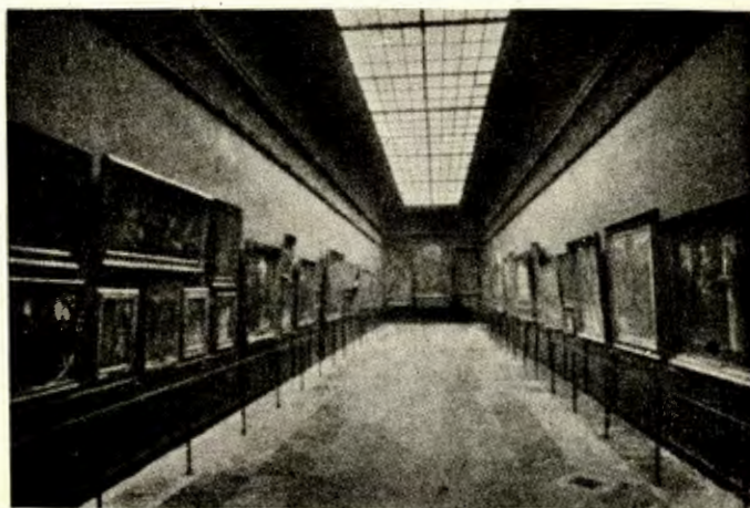
Sala de los Primitivos, antes de la transformación

Era pues de toda necesidad obrar, por respeto a la cultura y por amor propio nacional. Y esto ha sido hecho de manera sobresaliente: cuarenta salas nuevas o restauradas, claras, luminosas, en donde los objetos y las pinturas ya no se ven apiladas y donde se ha producido una atmósfera apropiada a la contemplación de las obras de arte. Estas primeras modificaciones, pronto le seguirán otras, han sido efectuadas en las salas destinadas al arte antiguo: griegos, romanos, egipcios