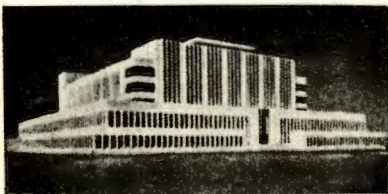
Laboratorio de productos forestales

la y un club muy bien logrados. Su nueva obra, una Casa de Retiro y Capilla para religiosas en Kresmunster (Austria), presenta grandes cualidades de composición y de distribución. El problema era delicado: se trataba de construir en el flanco de una colina, sobre