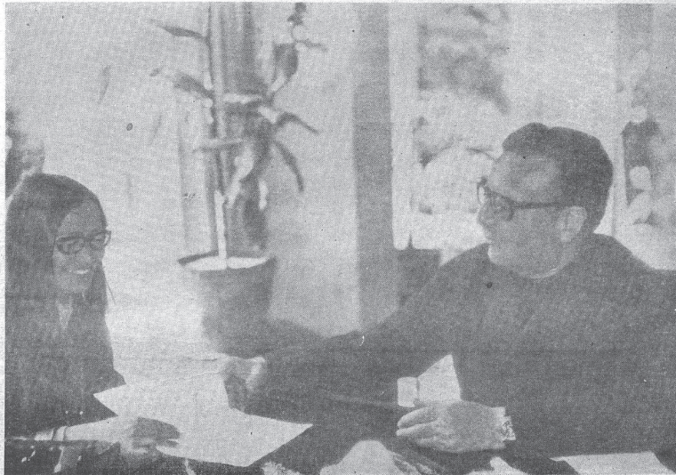
SALVADOR ALLENDE, en su casa de Guardia Vieja recibe al equipo de redactores de CLARIDAD. En la nota gráfica intercambia impresiones con nuestra directora Lily Corvalán.

imaginar que los problemas "generacionales" alcancen hoy una magnitud que los haga ocupar en la vida colectiva un sitio que por los elementos más determinantes del proceso social, como la lucha de clases, por ejemplo.