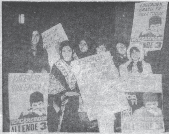
La participación de las mujeres fue fundamental durante la campaña. Y el aporte de las muchachas a esta movilización femenina alcanzo niveles nunca vistos en campañas políticas anteriores.