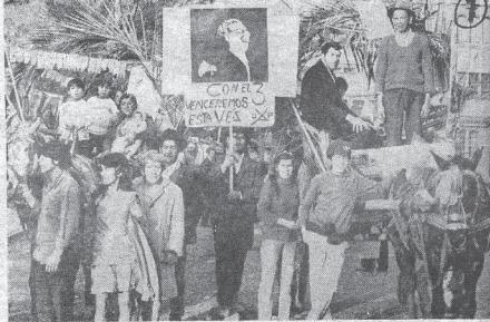
Belleza, entusiasmo y colorido en los desfilés populares. La imaginación juvenil estuvo al servicio de la causa.