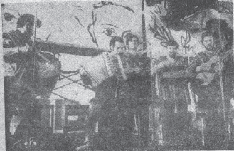
La juventud llevó arte y folklore al pueblo durante la campaña. EN LA FOTO, el Conjunto Aparceo.